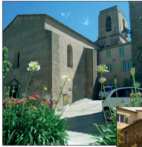
L'église Notre-Dame-de-l'Assomption (achevée en 1558). Notre Dame de l'Assomption' church (completed in 1558).