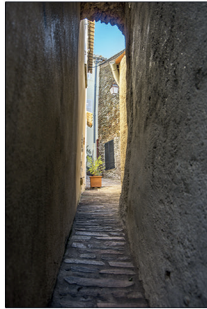
L'Androuno, connue comme la plus petite rue au monde. L'Androuno known as The smallest street in the world.