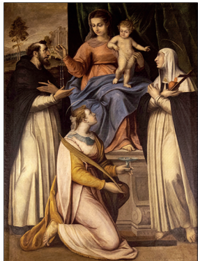
Le don du Rosaire, attribué à Coriolano Malagavazzo (1587) (église de Gassin). The Giving of the Rosary, attributed to Coriolano Malagavazzo (1587) (Church of Gassin).