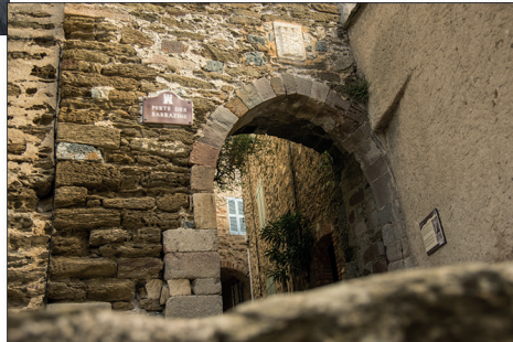
La Porte des Sarrazins qui gardait l'une des entrées de Gassin. The Porte des Sarrazins who guarded the entrance of Gassin.