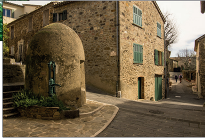
Le vieux Puits Neuf The old Puits Neuf ("New well")